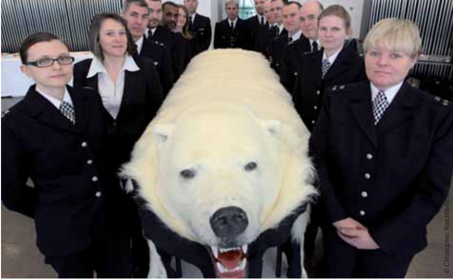
Blandt de 30.000 genstande, som politiet i London har beslaglagt siden 1995, er et tre meter langt isbjørneskind, to udstoppede tigerunger, elfenben, horn fra næsehorn og pels, der stammer fra udryddelsestruede dyr.