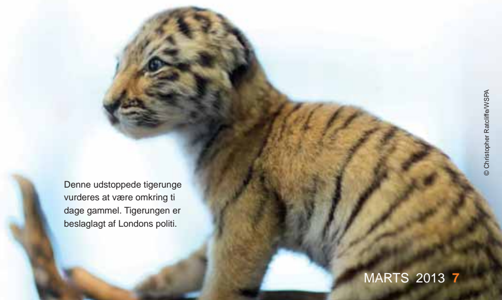
Denne udstoppede tigerunge vurderes at være omkring ti dage gammel. Tigerungen er beslaglagt af Londons politi.

KI. 16.00 Jeg pakker sammen og krydser fingre for, at der er en siddeplads til mig på toget hjem.