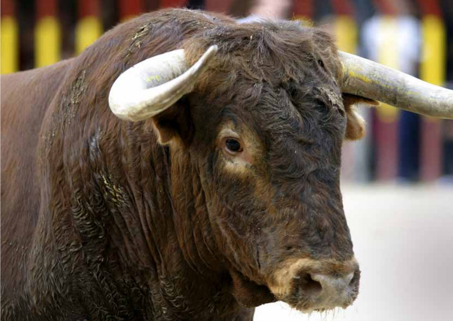
En tyr i tyrefægtningsarenaen