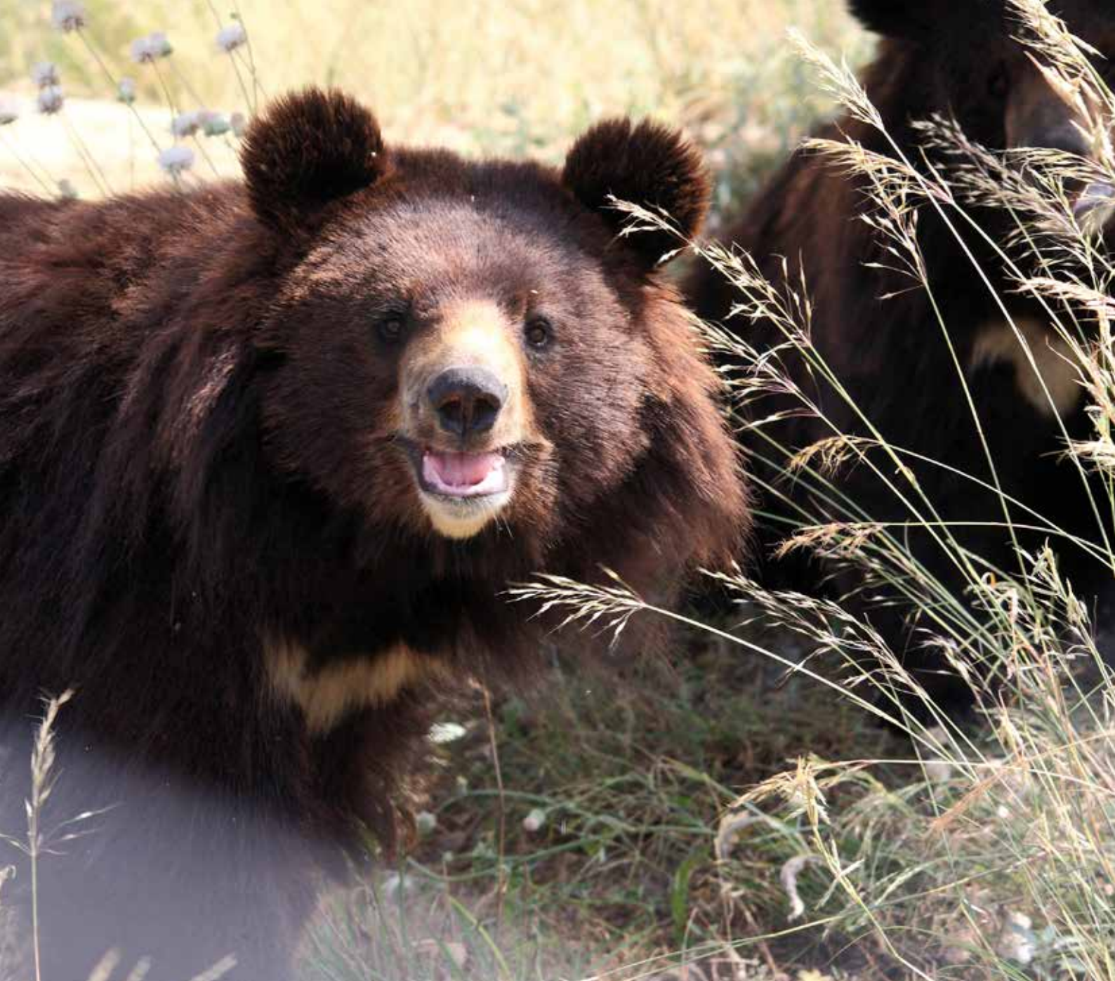
Rene har boet i bjørnereservatet i Pakistan siden 2012