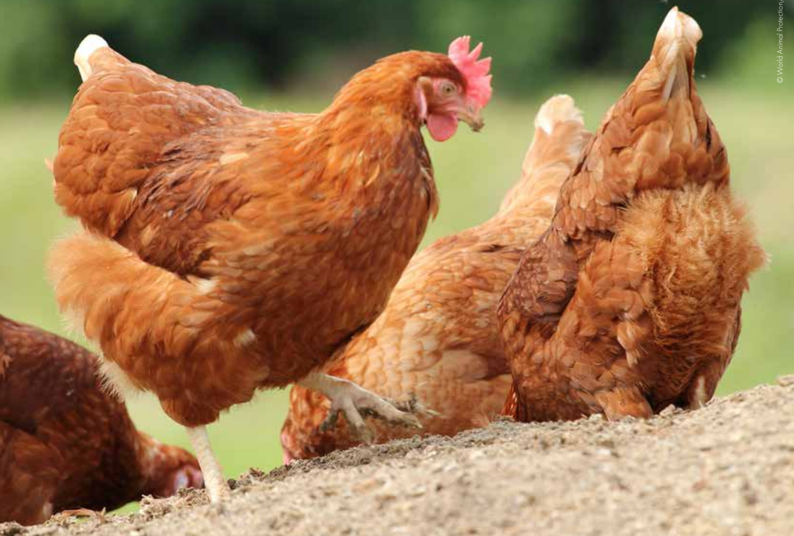
Disse fritgående høns bor på Rabbit River Farms i Canada